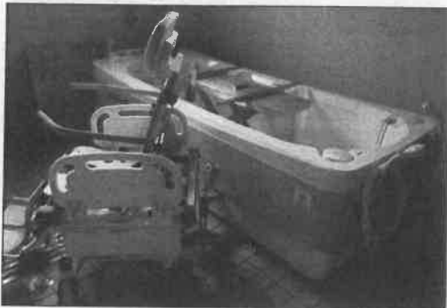
(社福) 草笛の会 静岡県 ウェルくさぶえ (特殊入浴装置)