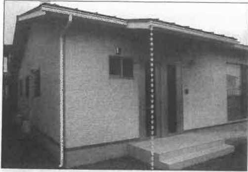
(NPO) シュシュ 栃木県 シュシュ (療育棟)