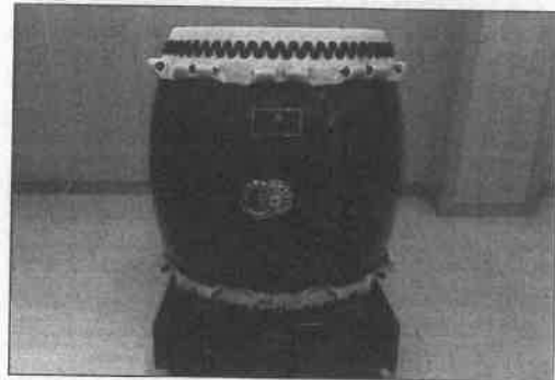
(社福) 清光会 大阪府 和泉の里 (和太鼓セット)